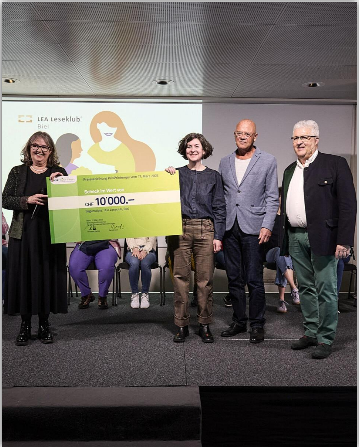
Preisverleihung PrixPrintemps 2025